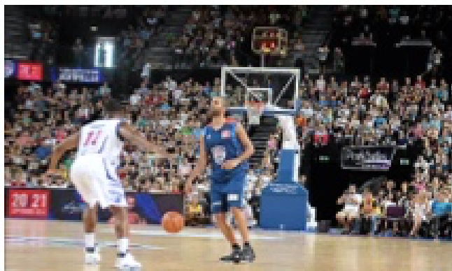
■ Tony Parker reviendra à l'Arena en septembre prochain.

Depuis, les choses ont quelque peu évolué. En effet, via twitter, la Fédération française de basket-ball a fait savoir, durant les vacances de Noël, que le site de Montpellier était maintenu. Elle « confirme que le premier tour de l'EuroBasket 2015 se déroulera bien à l'Arena de Montpellier ».